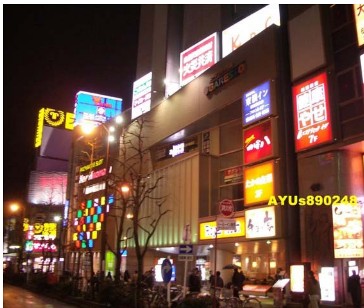
車站附近還算挺熱鬧的，在附近逛逛，本來想去伊勢丹百貨的，去車站詢問處問，小姐說八點就關了…，因為沒開又下毛毛雨，只好回Hotel結束一天的行程。