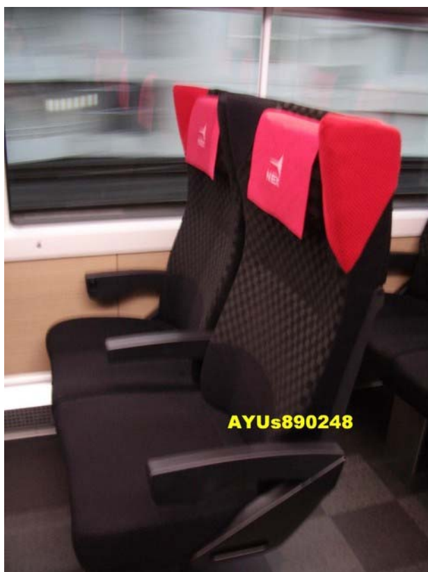
下午約4點多從「東京駅」坐JR NEX，我們去程回程的座位都是『普通車』。