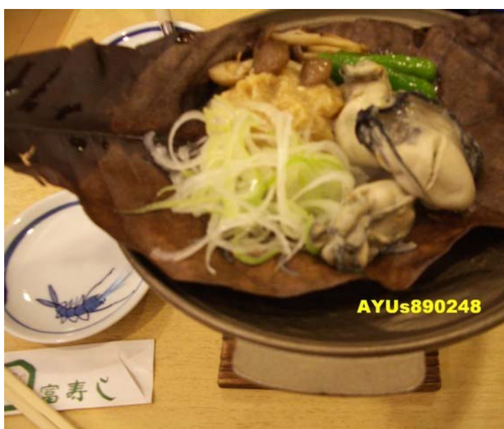
富寿し(富寿し餐廳官網)

約6點到車站附近的「富寿し」吃晚餐。我點的是類似味噌蚶仔的料理，大概七、八百日圓，拿出日本全國共通壽司卷付帳(總共有三千日圓)，因為是日本人給的，所以對禮卷的詳細資訊不太清楚…。