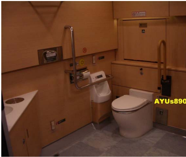
去上洗手間時有點被嚇到，因為看到一間外表是超大圓柱狀的廁所！