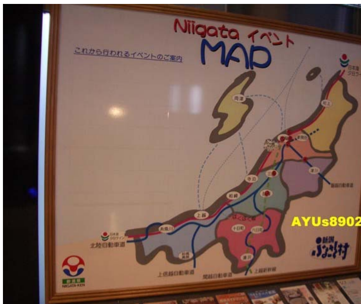
先到『アピール館(appeal館)』。這個館有新潟觀光情報和體驗歷史街道等…。我只在1F逛，沒上去2F有點可惜，真希望有時間能好好參觀呢～