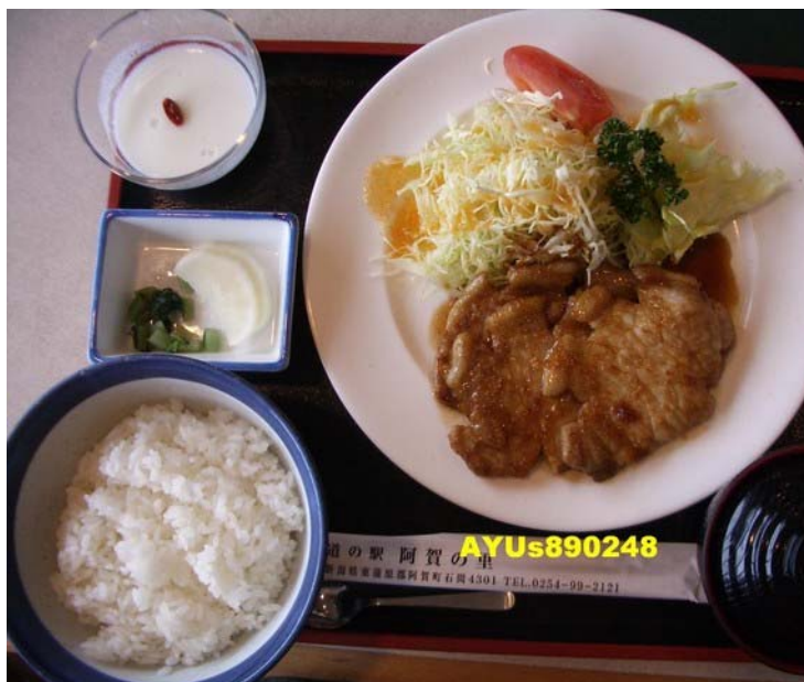
約2點到附近的「レストラン河畔」吃中餐。在這裡可以自己點餐了，我點的是『生姜焼き定食』(生薑燒肉定食)，豬肉很嫩很好吃！