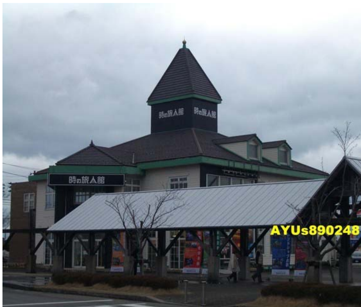
『時の旅人館』。裡面有新潟觀光情報等，在裡面有新潟市的紀念章可以蓋！參觀時間約30分鐘。