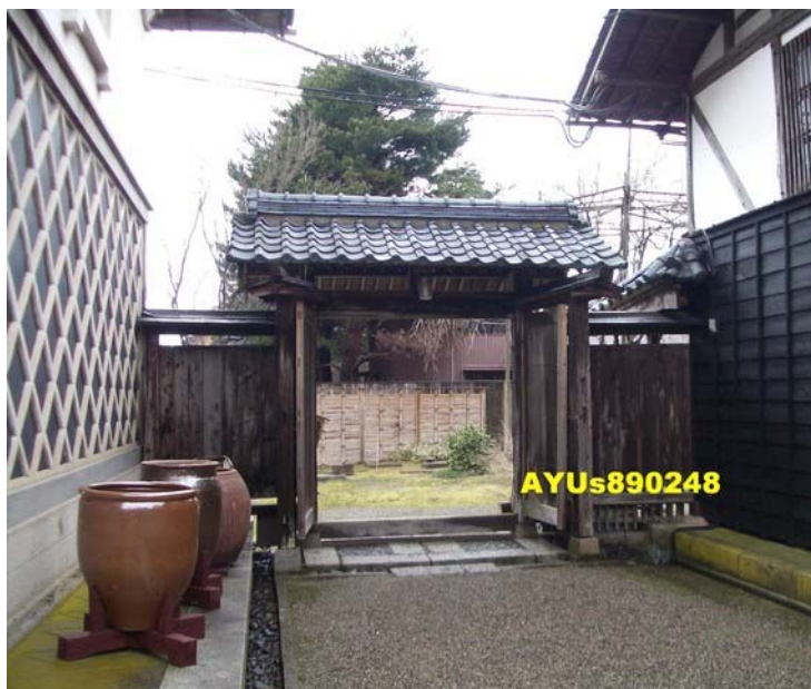
農業時代所使用的大缸子。