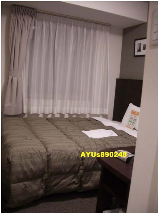
コンフォートホテル新潟駅前TOP | 観光旅行やビジネスホテルに最適なホテル (Comfort Hotel網址) 約5點多抵達今晚住宿的「Comfort Hotel」。房間跟第三天住的Hotel差不多小間，不過，有HD電視(我來日本第一次看到HD)、網路，1F也有免費的電腦可使用。離新潟車站很近，大概走5分鐘就到了。