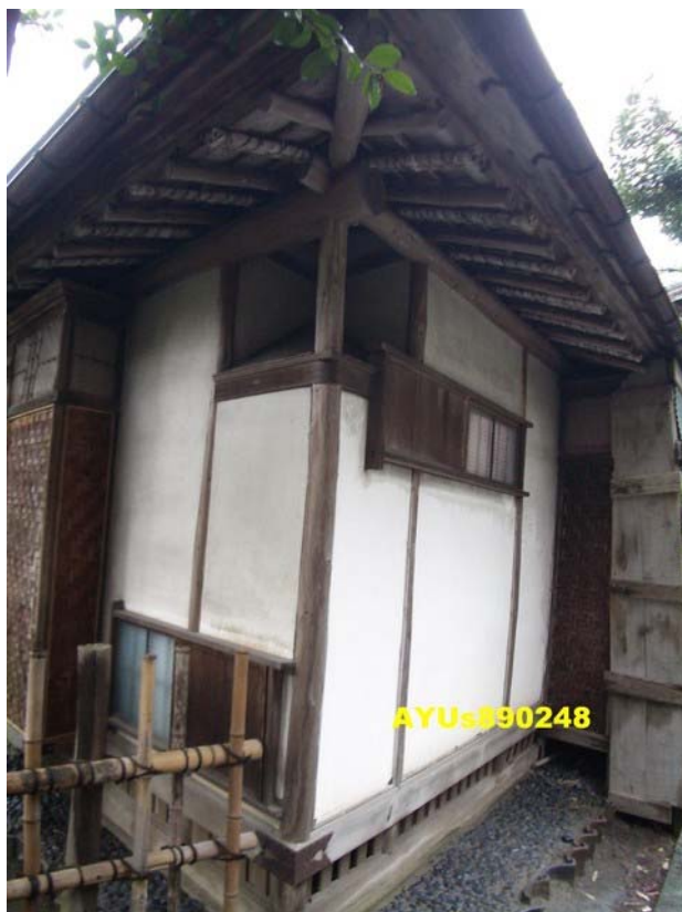
『三楽亭』。這棟建築物是三角形的！參觀時間約1小時。