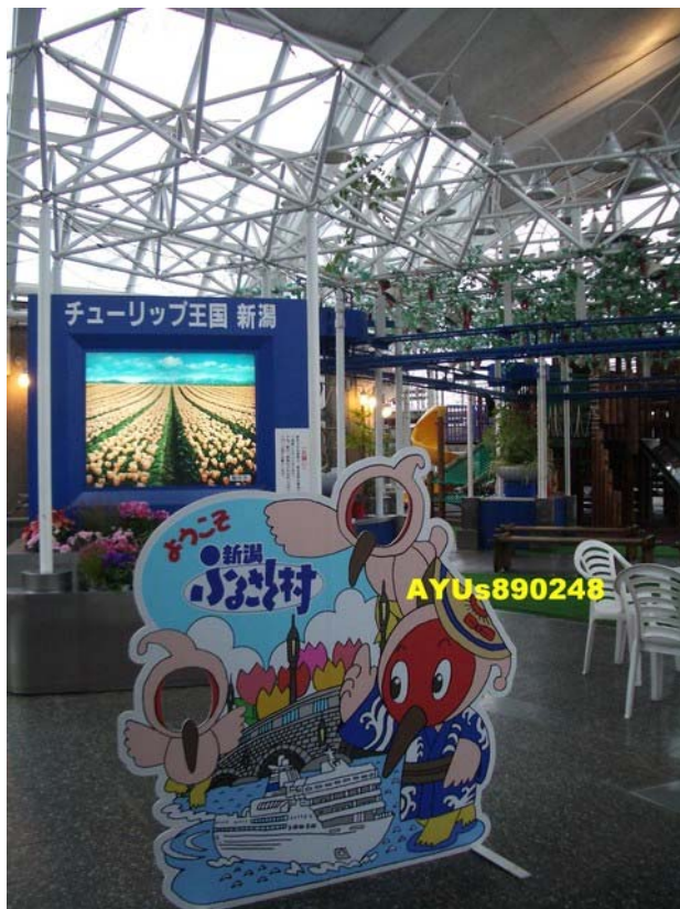
『グリーンハウス(green house)』。裡面有遊樂設施給小孩子玩，當天也有小學生來玩，正好是放學時間(?)