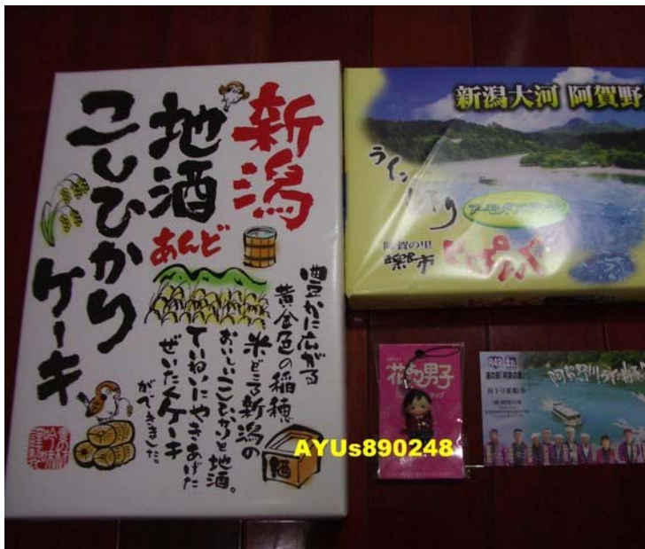
平河先生送的『新潟地酒あんどこしひかりケーキ』・『阿賀の里 楽市じばんぐアーモンドフロランタン』。一個是用新潟地酒和こしひかり(一種稻米)做的蛋糕，吃起來有點像蜂蜜蛋糕；一個是Zipangu almond florentin，像杏仁餅乾。

謝謝為我們導覽的道の駅阿賀の里的船頭-平河先生，非常感謝！ 平河さん、ありがとうございました！(^o^)