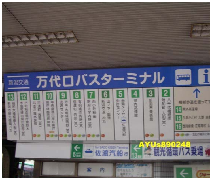
車站附近的巴士站。照片是隔天早上拍的。