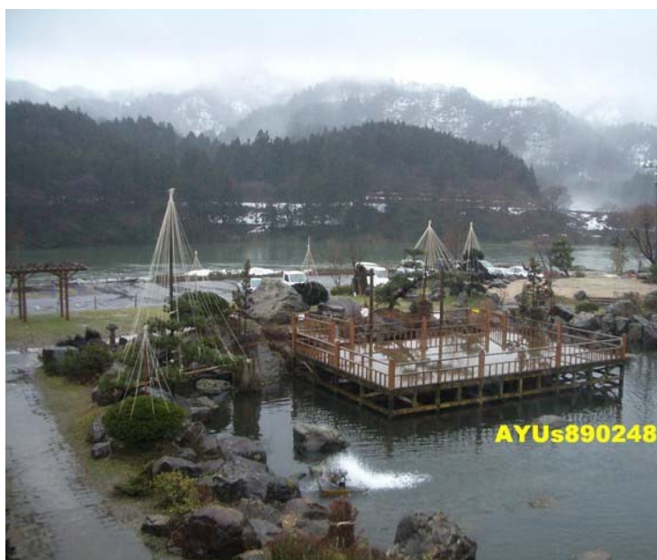
從餐廳照出去的景色。