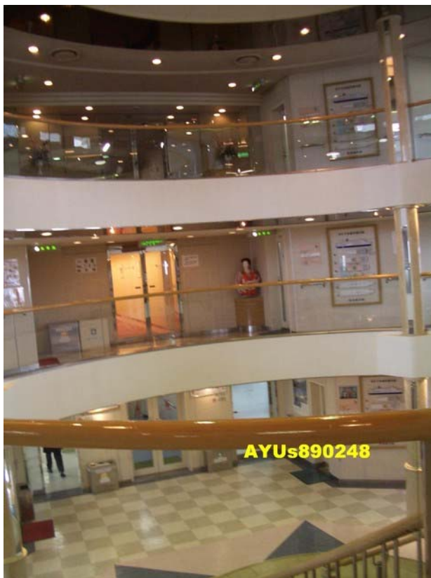
佐渡汽船株式会社(佐渡汽船公司官網)

在兩津港坐9點15分的船，這次回程坐的是『カーフェリー(car ferry)』(去程是『ジェットフォイル(jetfoil)』)。座位是4F的1等船室(ジュータン席)，但進入船內後，只要爬一層樓就到了。