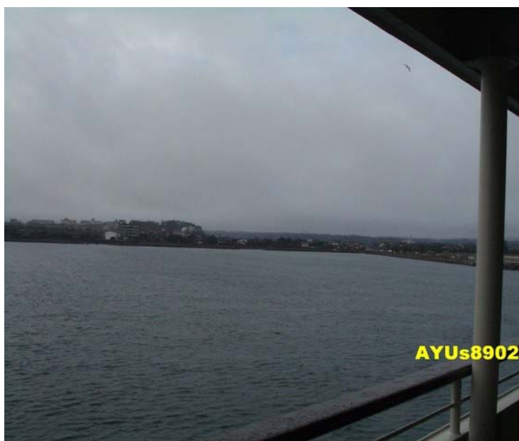
從船艙(?)上拍照。天氣不太好，有點毛毛雨，而且海風很大~