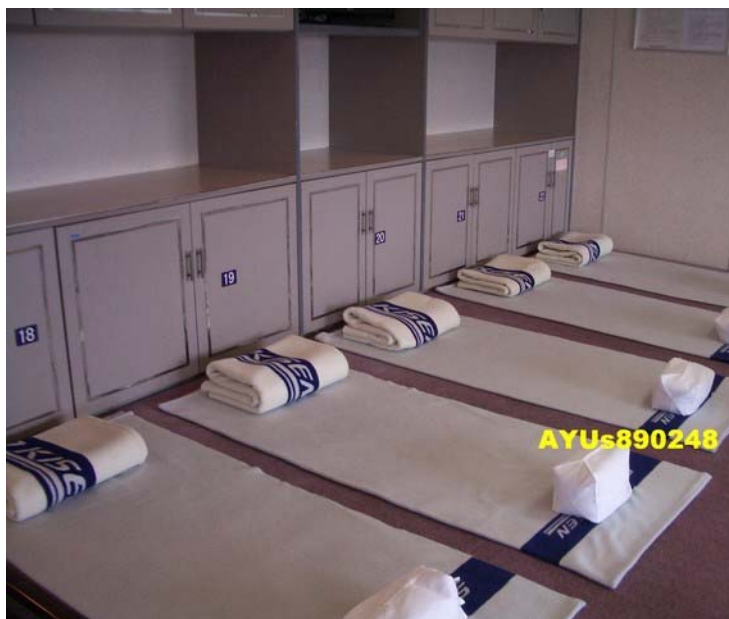
這個床舖就是座位，一間大概有30張床，內有窗戶能看海囉！