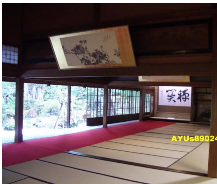
進入『豪農の館』。這是『大広間』。