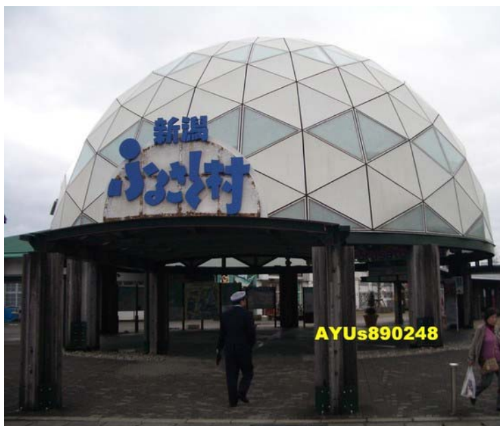
新潟ふるさと村-新潟県の観光と物産のプレゼンテーション施設 (新潟ふるさと村官網) 約4點多抵達「新潟ふるさと村」。這裡完全不用門票喔！