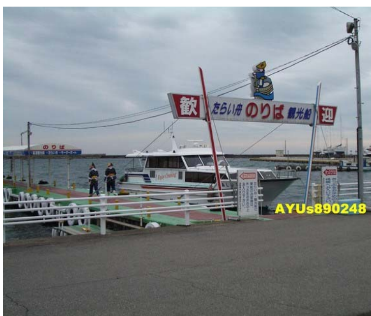
たい舟力屋観光汽船 (たい舟力屋観光汽船官網)

坐40分鐘的車，約4點10分抵達「たい舟力屋観光汽船」。此次要坐的是『たい舟』，由兩位女船頭帶路～