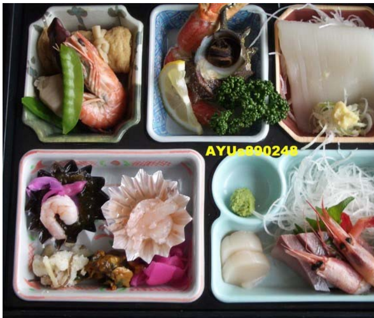
中餐是『和定食いさり火』，1點40分吃完中餐。