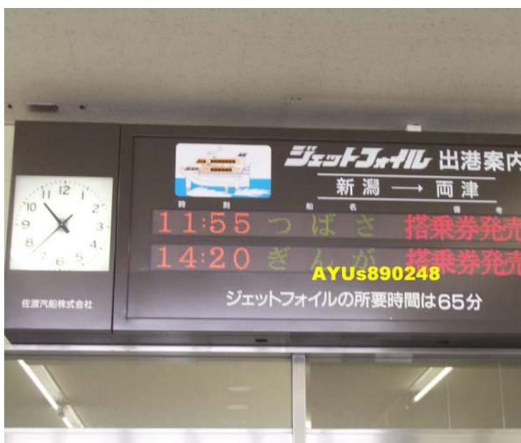
搭65分鐘的船即可到達「兩津」。