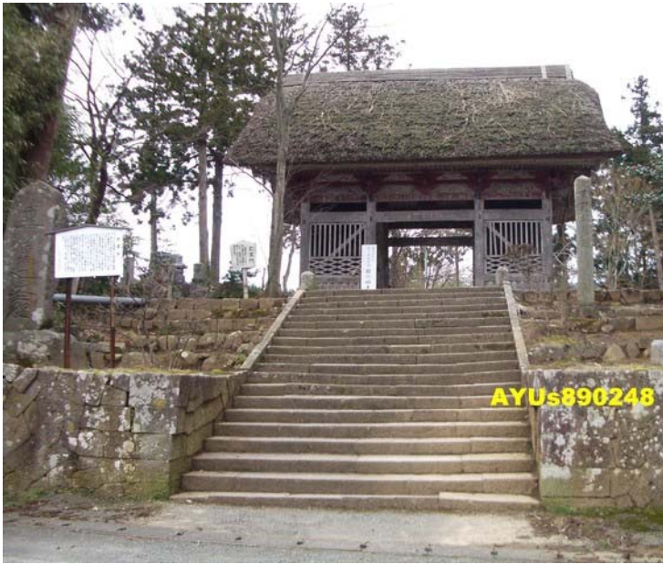
阿仏房妙宣寺：佐渡観光協会(介紹妙宣寺的網站) 坐25分鐘的車，約3點10分抵達「妙宣寺」。