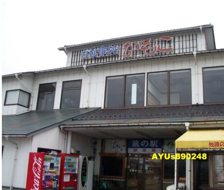
かもこ観光センター(かもこ観光中心官網)

一抵達「兩津港」，就有這天要住宿的「兩津やまきホテル」旅館人員舉旗歡迎，旗幟上寫著『熱烈歡迎台灣貴賓蒞臨』，我真的是嚇了一跳！台灣人應該很少來到兩津觀光吧！？途中，旅館小姐幫我提行李，結果她會說中文，這是在日本遇到第二位會說中文的人！我又要感動落淚了！