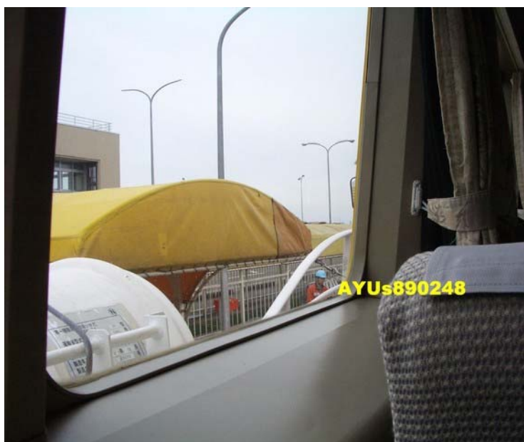
搭上船了。座位是在二樓，感覺這個時間的乘客以上班族居多。