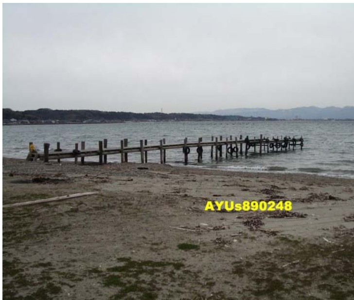
花45分鐘車程，約2點15分抵達「佐和田町」的沢根海岸。參觀時間約5分鐘。