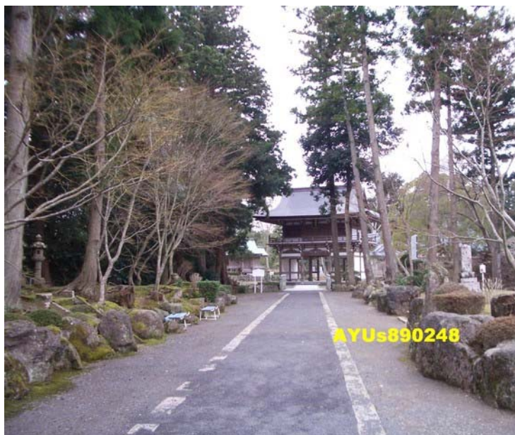
『阿佛房』。因為時間有限，無法參觀妙宣寺的每一處。參觀時間約20分鐘。