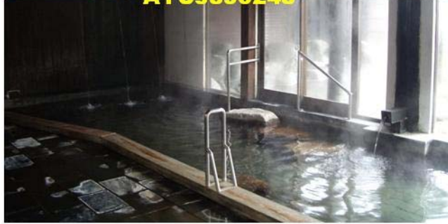
越後六日町温泉『温泉御宿 龍言』(龍言温泉旅館官網) 「龍言温泉旅館」。只是單純來參觀這間旅館= =