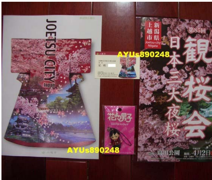
上越市觀光ホームページ ・ 上越観光ネット ・ 上越観光net (上越市觀光情報官網-內有中文版) 1點55分從「六日町駅」坐「北越急行ほくほく線」，3點抵達到「直江津駅」。接著，在直江津車站的附近逛逛，此時有上越市觀光部的足利先生做導覽，但可惜的是我相機沒電…。日本的櫻花一定很美吧！真想有機會去看看！日本の桜はきれいでしょ。本当に桜を見に行きたいです。足利さん、ありがとうございました！(^o^)