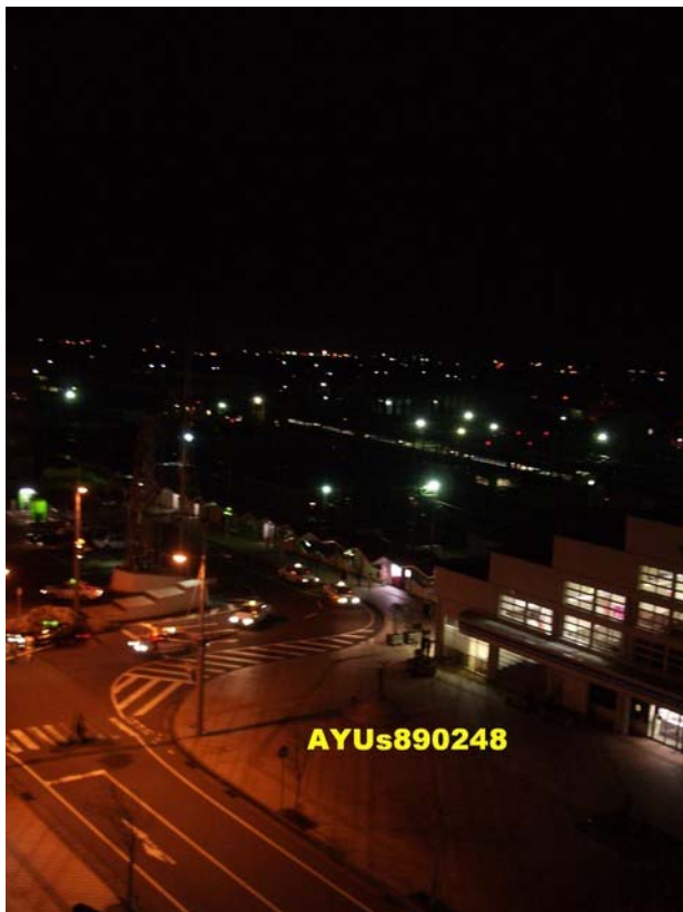
開窗就能看到直江津車站囉！我只能說房間真的很小= =