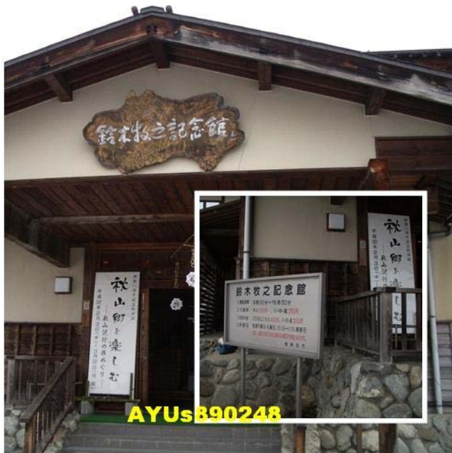
「鈴木牧之記念館」。這個紀念館沒有官網，館內也禁止拍照，所以就不多做介紹了。