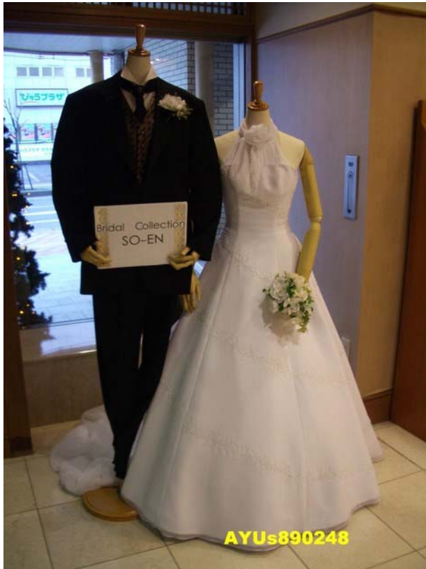
ホテルハイマート(HOTEL HEIMAT官網) 這天晚上住宿的「HOTEL HEIMAT」。一樓大廳展示著婚紗，小小的幸福感