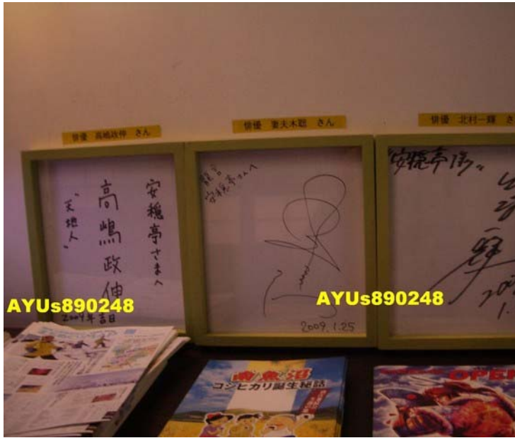
餐廳裡面有妻夫木聡、北村一輝、高嶋政伸的親筆簽名！就是沒有小栗旬的簽名阿~~~~。