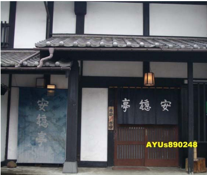
「安穩亭」。下午1點左右吃中餐，這家餐廳離龍言温泉旅館很近。烏龍麵很Q很好吃，但因為版主的相機這時已經沒電了，所以沒辦法拍…。