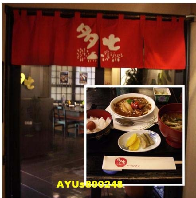
7點在飯店的『多七』吃晚餐，牛肉燴飯非常美味，和台灣的味道很相近。