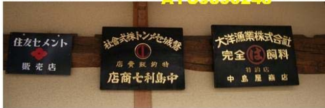
人孔蓋和消防栓。不得不說日本的人孔蓋非常平整，上面的花紋好像各區也不太一樣。