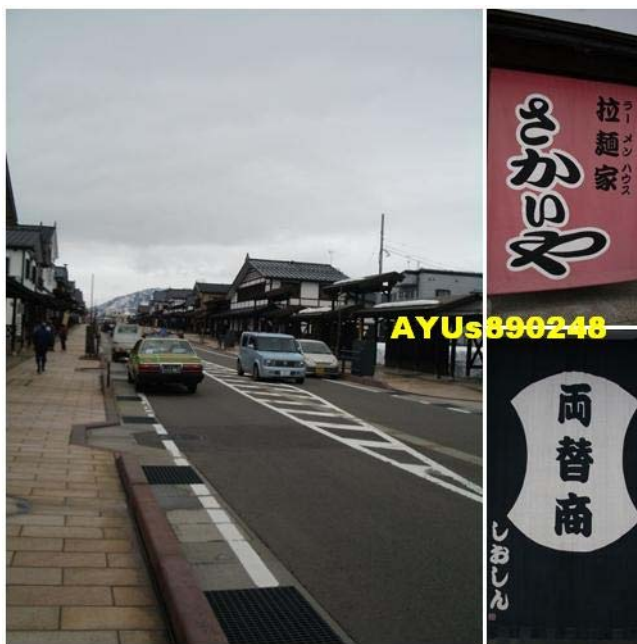
塩沢商工会新潟県南魚沼市塩沢地域の観光宿泊情報・各種情報(鹽澤地區觀光情報官網) 大約11點多抵達「塩沢町」的『牧之(ぼくし)通り』, 這是條充滿小町風味的文化大街, 有小餐館、紀念品店、工藝品店、賣酒的小店、郵局、書店等....